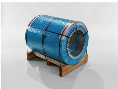
Verbundblech Jumbo Coil