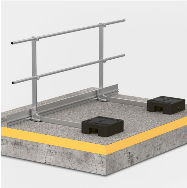
Abb. Barrial® selbsttragend standard