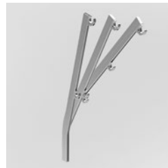
geneigt 15° / 30° / 45°