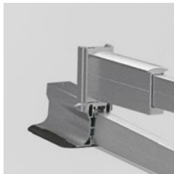
klappbar Abb. premium